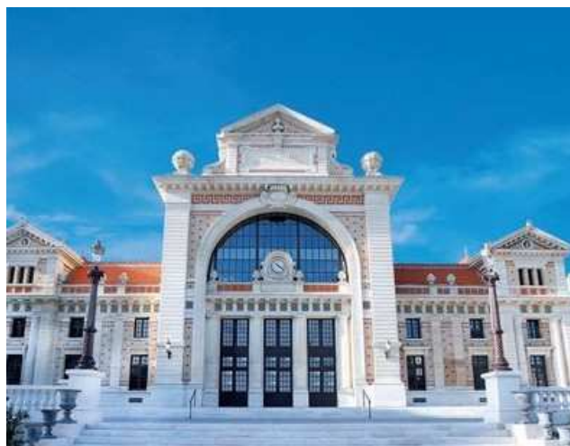
Bibliothèque Raoul Mille

Des dépôts gratuits de livres et CD dont proposés aux structures collectives et associatives de la ville de Nice.